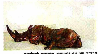
עבודה של גיא זגורסקי. מודעות לבלוטות