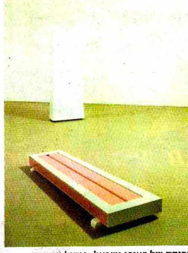
עבודה של ראובן ישראל. מיסול עצמאי