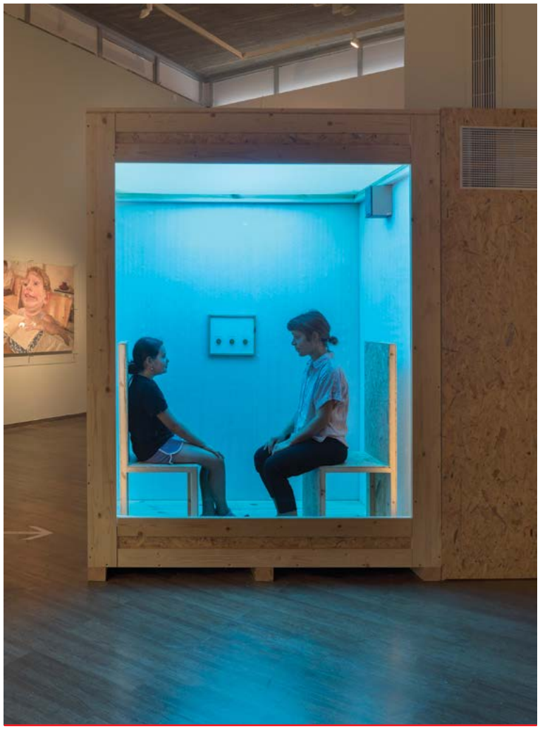
'מְתֵי בַּפְעַם הָאֲחֵרוֹנָה?'. מִיֵּצֵב שִׁיחָה עֵינַת עֵמִיר בִּשְׁנַת 2018. זִוְגוֹת שֶׁל מְבַקְרִים מוֹזְמָנִים לְהִתְיַשֵּׁב זֶה מוֹל זֶה וְלַעֲנוֹת לְשִׁאלוֹת מוֹקְלָטוֹת הַנוֹגְעוֹת לְמַחְשְׁבוֹתֵיהֶם וְלְרַגְשׁוֹתֵיהֶם. הַזִּוְגוֹת יוֹשְׁבִים בְּתַאִים שְׁקוֹפִים, כִּךְ שֶׁהַמְּבַקְרִים הָאֲחֵרִים רֹאִים אוֹתָם אֲךָ לֹא שׁוֹמְעִים מֵהֶם אוֹמְרִים