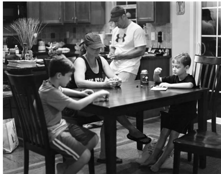
'גִּימֵי וּמִשַׁל'. צִילֵם אֲרִיק פִּיקֶרְסְגִיל בִּשְׁנַת 2014. בְּמַבְט רֵאשׁוֹן יֵשׁ מִשְׁהוֹ מֵטְרִיד וּמְשַׁעֵשֵׁעַ גַּם יַחַד בְּתַמוֹנוֹת הַקְּבוּצָתִיּוֹת שֶׁל אֲנָשִׁים הַבוֹהִים בְּכַף יָדָם הַרִיקָה